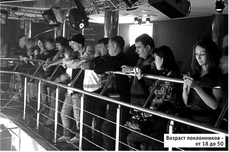
Возраст поклонников - от 18 до 50

Рецепт от Алексея Никитина «Антипохмельный» — 250 г водки, — 250 г сильногазированной минералки, — лимон, лед. Все смешать и выпить залпом на голодный желудок. Дозу алкоголя варьировать по живому весу.